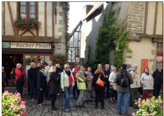
Rochefort en Terre

Un groupe de 50 personnes d'Helmstedt est venu nous rendre visite du 15 au 19 septembre 2017.